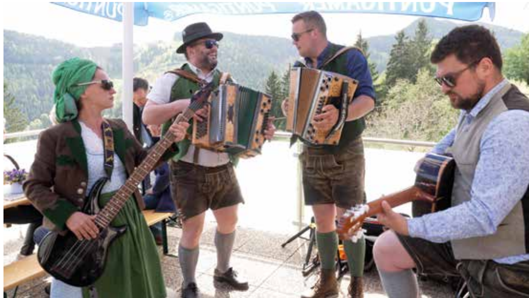
Der Musikfrühling 2026 sorgt für Stimmung und Unterhaltung am Berg und im Tal

Den Start bestreitet die Poldl Hausmusi und die Gruppe Spätlese beim Gasthaus Poldlwirt am Sonntag, dem 26. April ab 14.00 Uhr. Die weiteren Termine gibt's in der April-Ausgabe des Stadtjournal – es erscheint am 24.4.