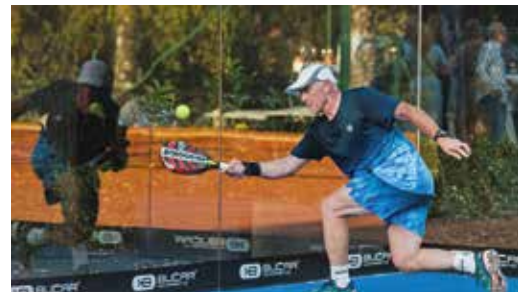
Padel-Tennis zählt zu den am schnellsten wachsenden Sportarten auf der ganzen Welt