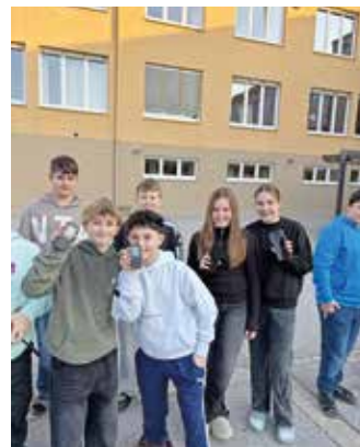
Ein Großteil der Schüler:innen legt das Smartphone weg. Manche nutzen in dieser Zeit das alte Tasten-Handy.

Es soll ein Zeichen für mehr Lebensqualität sein, als am Mittwoch, den 4. März 2026, an der Mittelschule Frohnleiten ein einzigartiges Experiment begonnen hatte, bei dem auch Schulen aus halb Europa teilnehmen. Die gesamte Schulgemeinschaft – Schülerinnen und Lehrpersonen – versammelt sich um 8:00 Uhr im Schulhof, um gemeinsam ihre Smartphones auszuschalten und für drei Wochen beiseitezulegen. „Wir wollen zeigen, dass wir es gemeinsam schaffen und uns gegenseitig